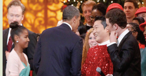
싸이와 오바마 미 대통령 <크리스마스 인 워싱턴> 공연 현장