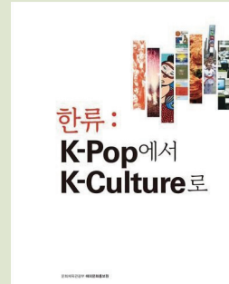
한류 종합소개서 표지