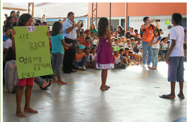
브라질-한국 문화의 날 행사현장