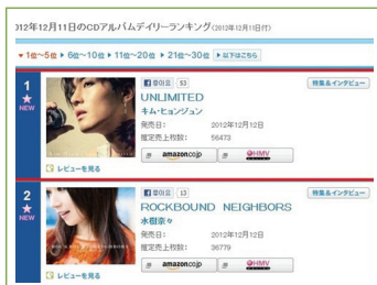
김현중, 오리콘 1위 차지

* 웅산 : 한국의 재즈보컬리스트. 한국, 일본을 주무대로 활동. (주요 경력) 5집 <클로즈 유어 아이즈> ‘스윙저널’ 골드디스크 수상, <원스 아이 러브드> ‘제5회 재즈오디디스크대상’ 보컬 부문 금상 수상 ** 일본프로음악 녹음상 : 일본 내 권위 있는 상 중 하나. (운영위원회) 일본오디오협회(JAS), 일본음악스튜디오협회(JAPRS), 일본믹서협회(JAREC), 일본레코드협회(RIAJ), 연주가권리처리합동기구(MPN), 일본방송협회(NHK)