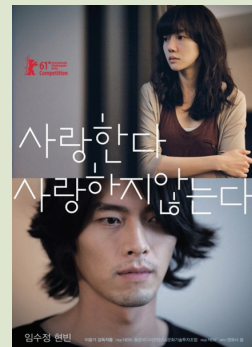
<사랑한다, 사랑하지 않는다> 포스터