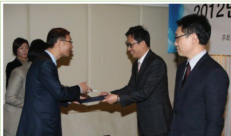
구글코리아 수상 현장