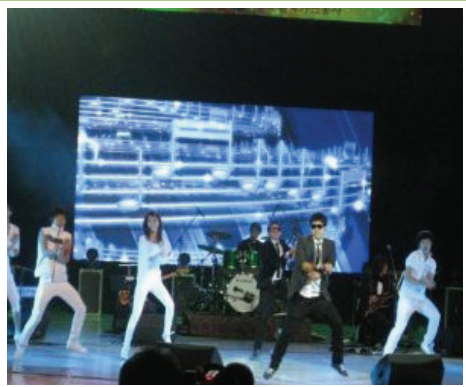
〈노장불패〉 녹화 모습