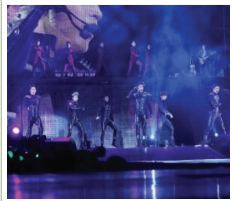
2PM 콘서트 모습

* G-Music : 대만 3대 음악 사이트 중 하나( http://www.g-music.com.tw )