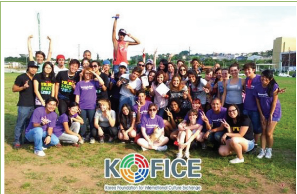
행사에 참여한 팬들