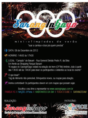
미니 올림픽 포스터

* 한류 팬클럽 '사랑인가요' : 브라질 K-Pop 대표 팬클럽. 회장 나탈리아 박. 홈페이지 방문자 수 하루 평균 약 4천 명