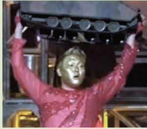
'02년 Mnet 뮤직비디오 페스티벌, 싸이 퍼포먼스