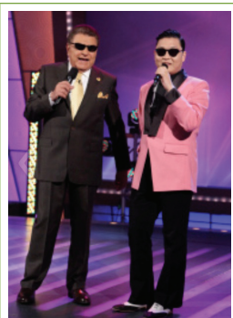
사바도 기간테 출연 모습

**** 올해의 바이럴 센세이션(Viral Sensation of the Year) : 미국 음악전문채널 MTV, 한 해 동안 빠른 속도로 소문이 퍼져 주목받은 음악 또는 뮤직션 선정