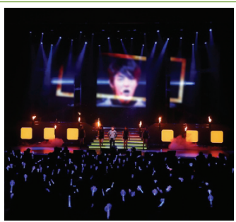
이준기 팬미팅 모습