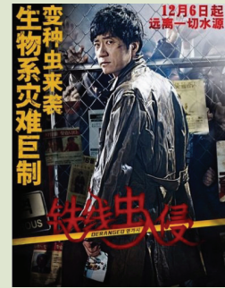
〈연가시〉 중국 포스터