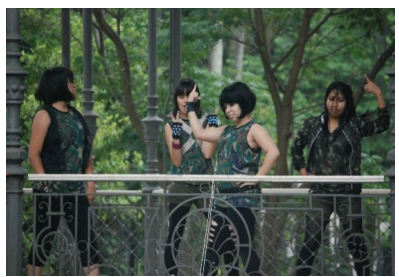
한국 문화 공연