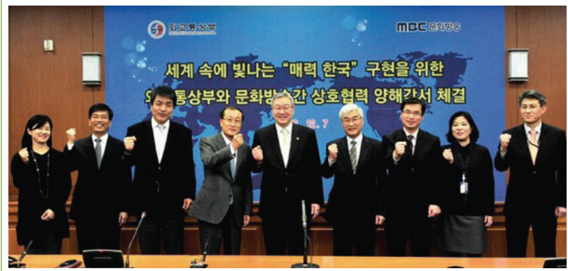
협약식 체결 현장