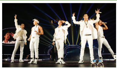
영국 공연 현장