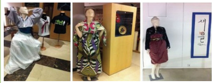
한복 디자인 수상작 시연