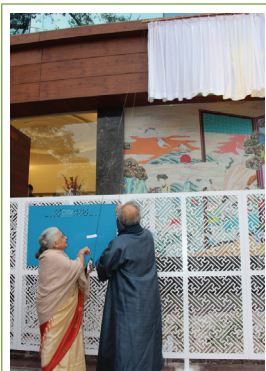
뉴델리 한국문화원 개관 모습