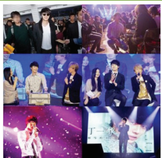
정일우 팬미팅 모습

○ 정일우, 대만 팬미팅 'The First Snow Promise' 성황리 개최(‘12.12.8, 네오 스튜디오)