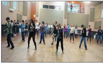
K-Pop 댄스교실 모습