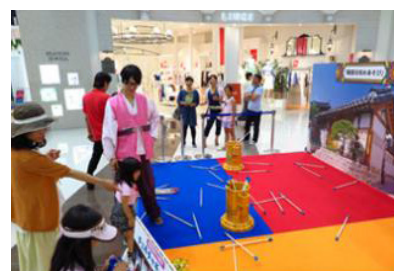
한국 문화 체험 행사 모습