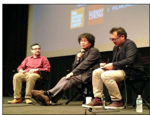
관객과의 대화 모습