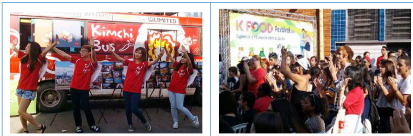
K-Food 행사 모습