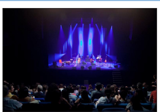
개막 공연 모습

○ '제2회 한국의 봄' 축제 개최('14.6.13~21, 낭트시 일대)