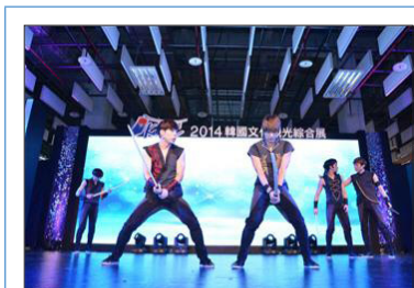
뮤지컬 <화랑> 공연 모습