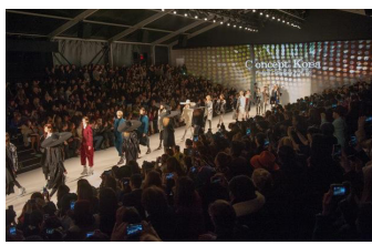
런웨이 피날레 현장