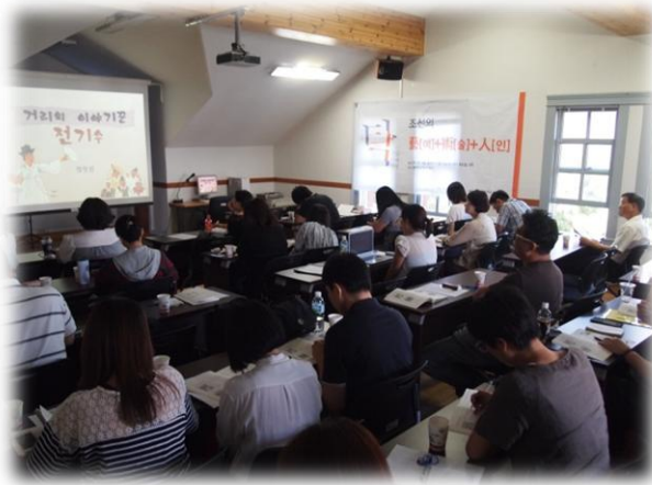
<조선의 예술인> 수업