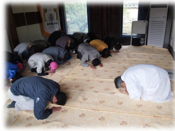
<화려함과 소박함의 우리소리> 안동답사_퇴계 종손과의 만남