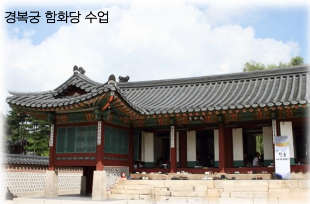
경복궁 함화당 수업